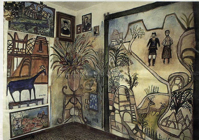
Bonaria Manca, výzdoba stěn vlastního domu, Tuscánia, Itálie

„Je to ve mě jako v koze.“ odpovídá na dotaz, kde že se „to“ v něm bere, Václav Zák, který pomaloval interiér i exteriér svého domu v Unhošti u Kladna. Žákově životní dílo po jeho smrti zaniklo, zůstalo jen pár okouzličujících naivních krajinomaleb na skle, roztroušených po soukromých sbírkách, a filmové svědectví, které pod názvem Dům radosti natočil režisér Ewald Schorm. Tento a další dokumentární filmy o spontánních tvůrcích zhlédli dne 20. 3. diváci 2. ročníku festivalu Art brut film Olomouc.