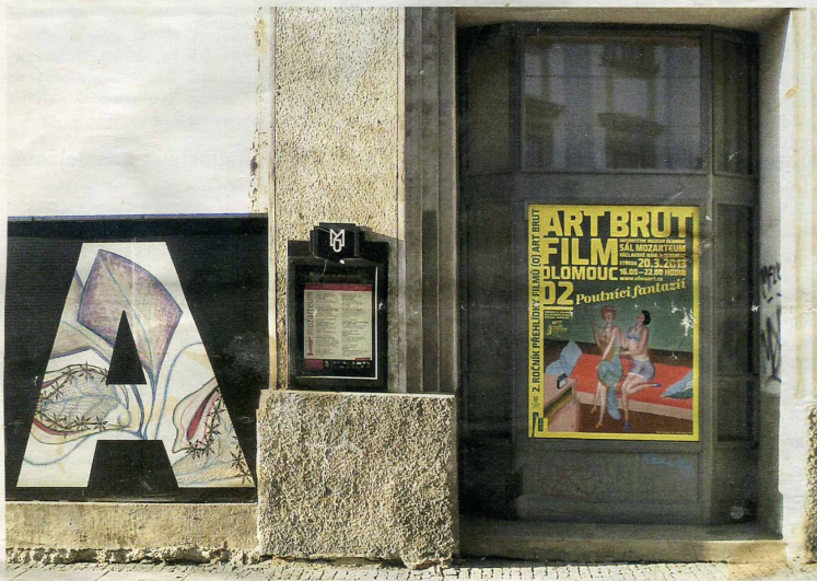
Petr Smalec, plakát k přehlídce Art brut film Olomouc 2013 s použitím obrazu naivního malíře Václava Beránka